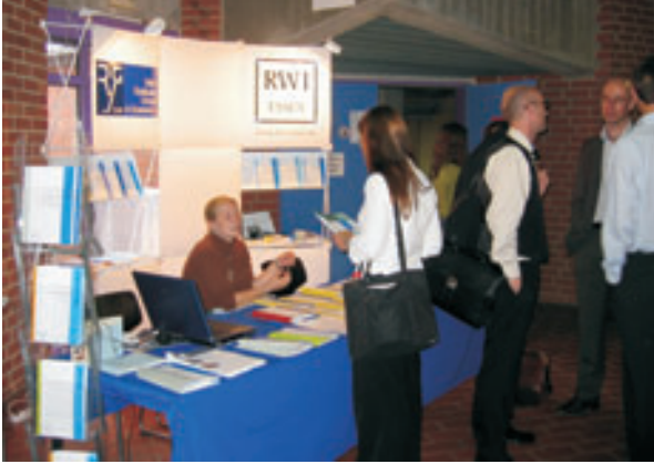
Bei der diesjährigen Jahrestagung des Vereins für Socialpolitik in Bayreuth war das RWI Essen nicht nur mit vielen Wissenschaftlern, sondern auch wieder mit seinem Stand vertreten

Auch in diesem Jahr war das RWI Essen wieder bei der Jahrestagung der European Economic Association (EEA) vertreten. Sechs RWI-Wissenschaftler präsentierten in Wien ihre wissenschaftlichen Papiere. Darüber hinaus war das Institut wieder mit seinem Stand vor Ort, um europäischen Wissenschaftlern einen Einblick in seine Arbeit zu geben. Werbung gemacht wurde bei dieser Gelegenheit auch für die RGS